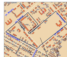
Границы территории межевания